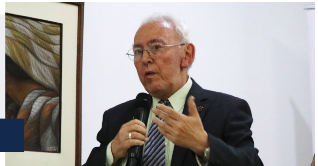
Enrique Posada Presidente de la SAI

La agremiación de ingenieros del departamento resaltó las obras realizadas, especialmente por la construcción del nuevo Túnel de Occidente, la Doble Calzada entre Medellín y Santa Fe de Antioquia, el nuevo puente sobre el río Cauca y toda la infraestructura vial, de 181 km, que conecta con seguridad, eficiencia y dinamismo a Medellín con 13 municipios del Occidente y Suroeste antioqueño.