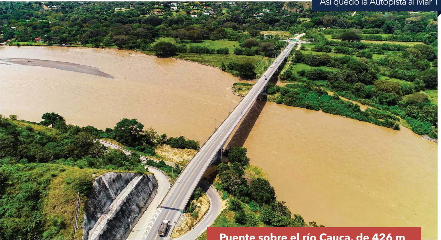
Puente sobre el río Cauca, de 426 m